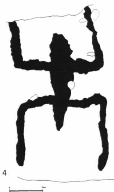
Fig. 1 - 1, ubicazione della necropoli; 2, incisione sul lato sinistro; 3, la necropoli; 4, rilievo dell'"orante".