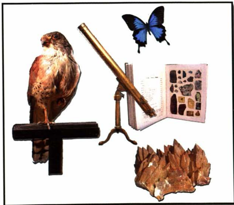
Fig. 1 - Museo della Scienza e della Tecnica dell'Università di Sassari. Beni storico - scientifici da varie Collezioni ( Collezione Zoologica, Collezione di Fisica, Collezione Geo - mineralogica ).